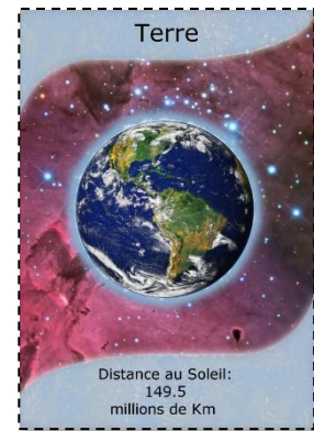
Carte planète Terre

Puis définir des distances relatives approximativement correctes (voir tableau). Pour cela définir distance maximale au Soleil disponible dans votre zone de jeu et l'attribuer à Neptune, et recalculer approximativement les distances de chaque planète (exemple dans le tableau pour Neptune à 20m). Cela permet de visualiser la répartition des planètes dans le Système solaire.