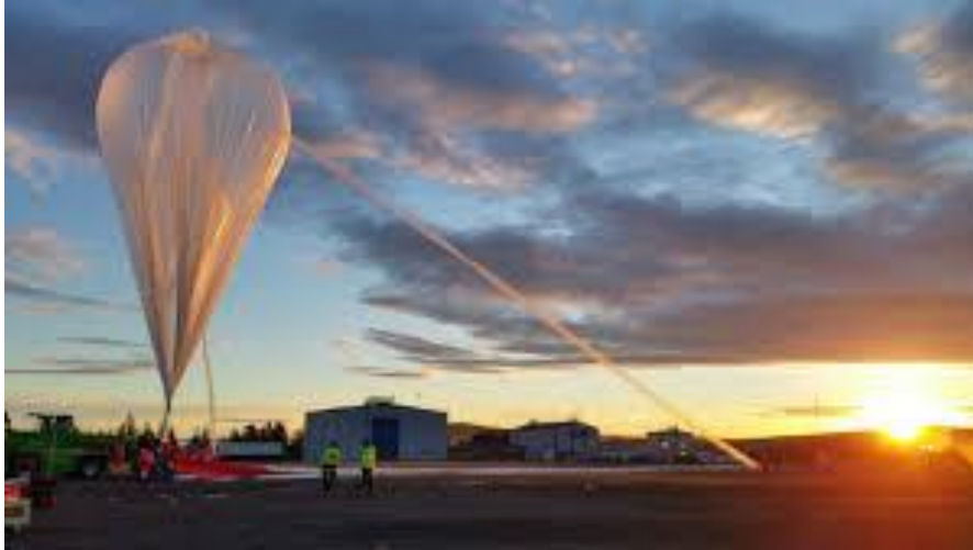
Figure 2 : BSO en cours de gonflage