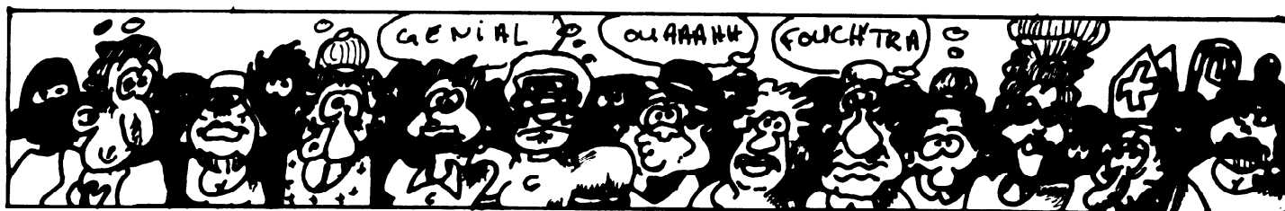
- exemple de foule ébahie -

Vous y rencontrerez des clubs parisiens qui, de 15 h 00 à 19 h 00, dans le cadre de l'opération "Le Métro à ciel ouvert" tiendront un stand présentant, à la foule ébahie, leurs activités et leurs réalisations.