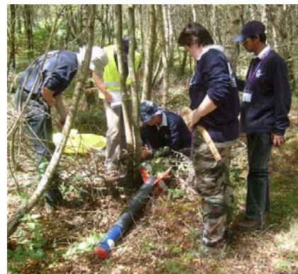
The team easily found its rocket, thanks to the estimation of the position by the localisation team.

What about French projects ? Aero Ipsa launched its rocket on Friday with a new commercial engine pro-54 made in Canada. The flight was nominal. The smoke helps the audience to see clearly the trajectory of the rocket. Next year, this kind of engines will replace CNES engines called 'Chamois' and 'Isard'.