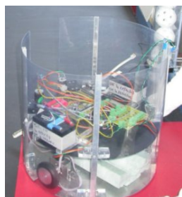
Robot « Elefan bleu »

Juste avant le dîner, les 2 équipes robotiques du Furo (Trucky et Eléfan Bleu) ont fait une présentation du règlement de la Coupe de Robotique 2008 et une démonstration des robots autonomes mis au point en 3 semaines seulement... un grand bravo aux concepteurs !