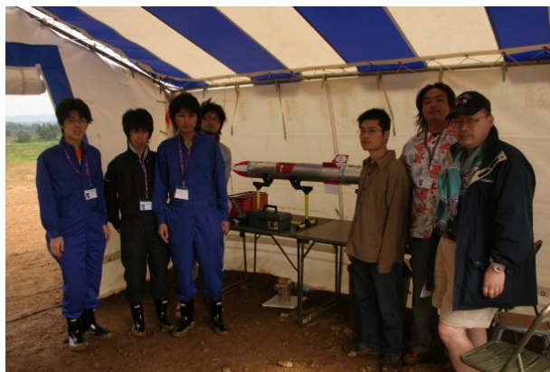
UCG team in « Tente-club »

Some news about Japanese rockets. UCG-07 was launched on Thursday. The first stage had a ballistic flight whereas the second stage and the quasi-satellite had a slowly fall with parachute and were found by the team.