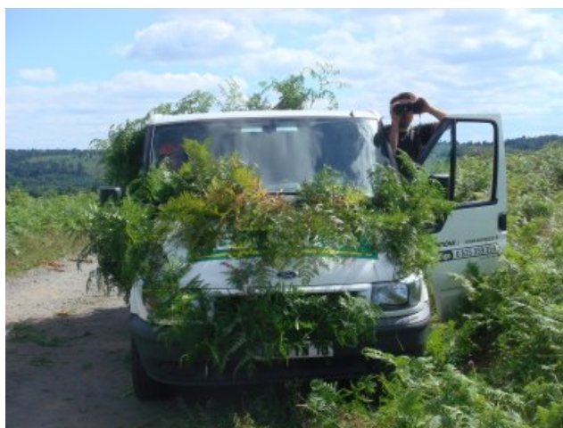
La version « camouflage » du camion récup