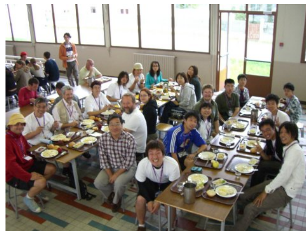
The complete UCK team

And, if you come to Japan, we will welcome you as our family.