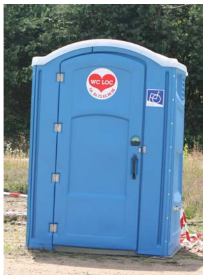
Après les PC loc, les WC loc !