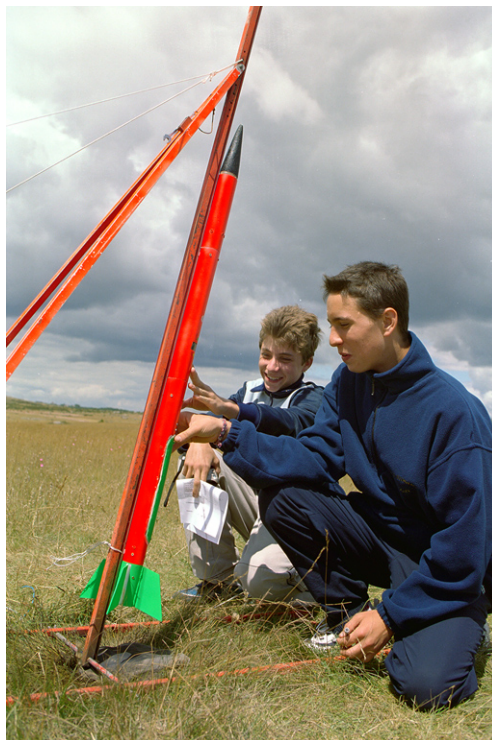
Mise en rampe d'une minifusée

Planète Sciences et les associations relais se voient confiées par le CNES le suivi des projets. Un animateur bénévole (appelé suiveur) sera désigné pour chaque classe retenue dans laquelle il interviendra plusieurs fois au cours de l'année pour assurer un soutien technique des élèves et enseignants.