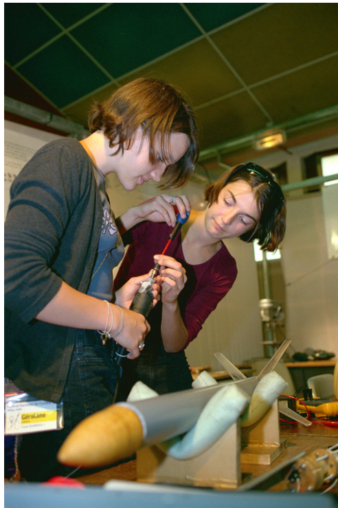
Préparation d'une minifusée

Le présent document est mis à jour régulièrement. Aussi, n'hésitez pas à nous faire parvenir vos remarques, critiques et suggestions !