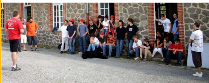
Les jeunes du Furo devant leur QG de La Courtine écoutant attentivement (pour une fois) leur leader.

D'ici-là, même s'ils sont "un peu" excentrés sur le camp, n'hésitez pas à aller leur faire un petit coucou : ils vous réserveront un accueil sans pareil... surtout si vous avez un Twix avec vous !