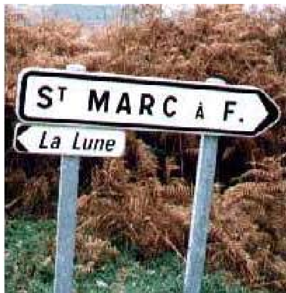
Tous les chemins mènent en Creuse